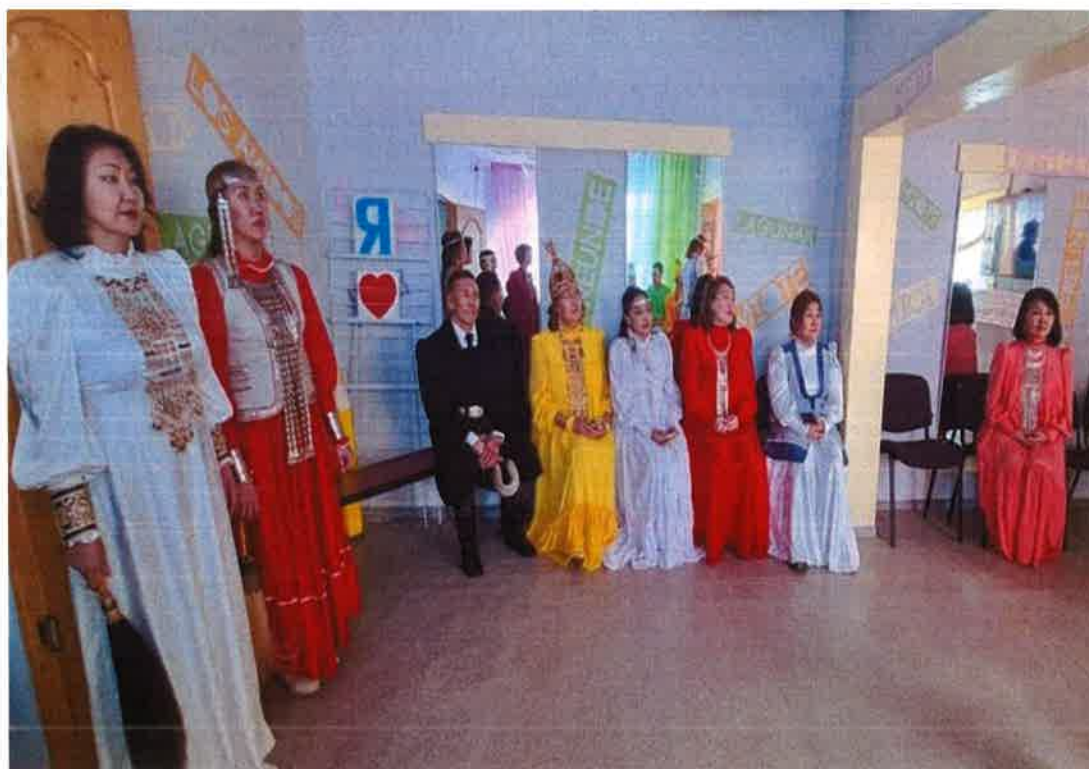
Педагоги школы - День национальной одежды