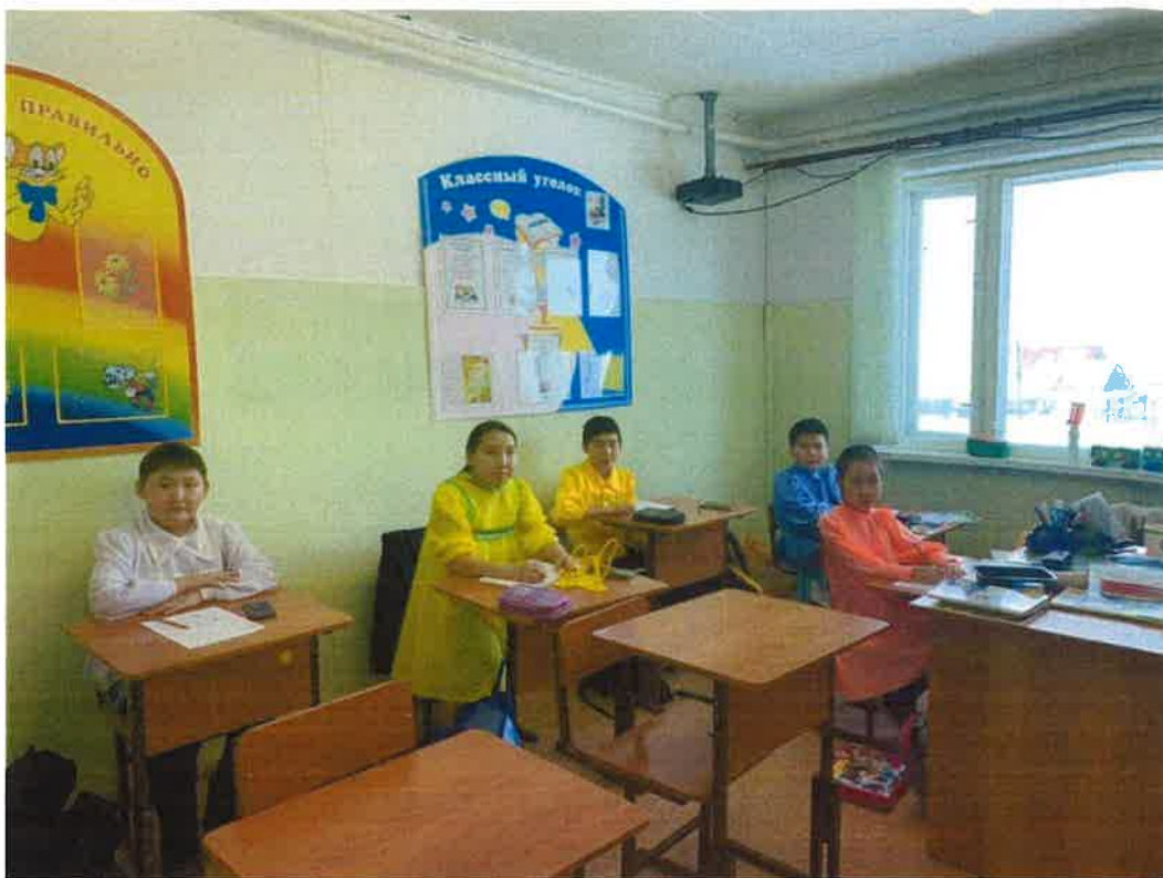
Обучающиеся 4 "б" класса - День национальной одежды.