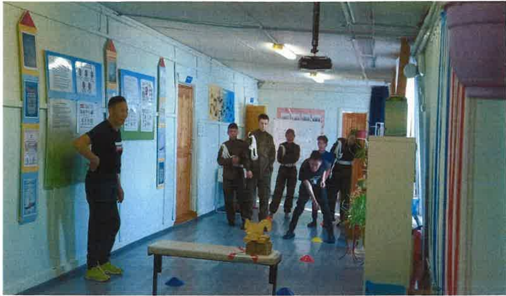
Моменты «Веселых стартов»

21 февраля 2021 года в школе прошла военно-спортивная квест – игра «Баабыр» среди обучающихся очного обучения. Участвовали 5 команд: начальные классы - 2-4 классы, старшие – команда воспитанников интерната и команда 10 класса. Всего этапов было 5