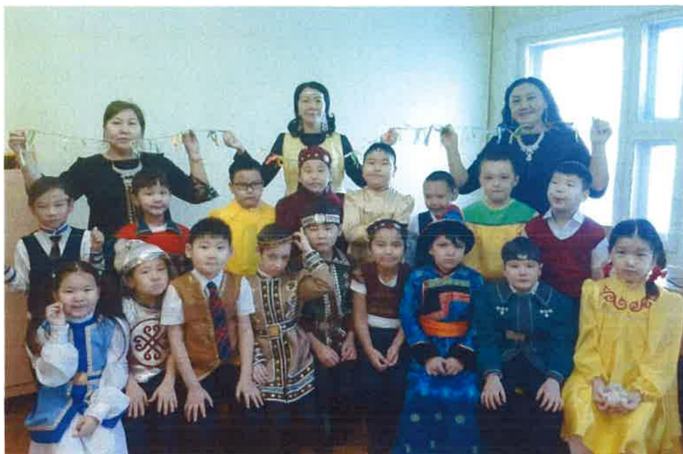
Обучающиеся 1 дополнительных классов – День национальной одежды