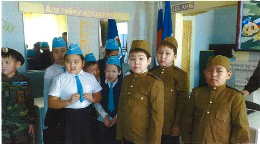
Команда 2 класса, занявшая 2 место.