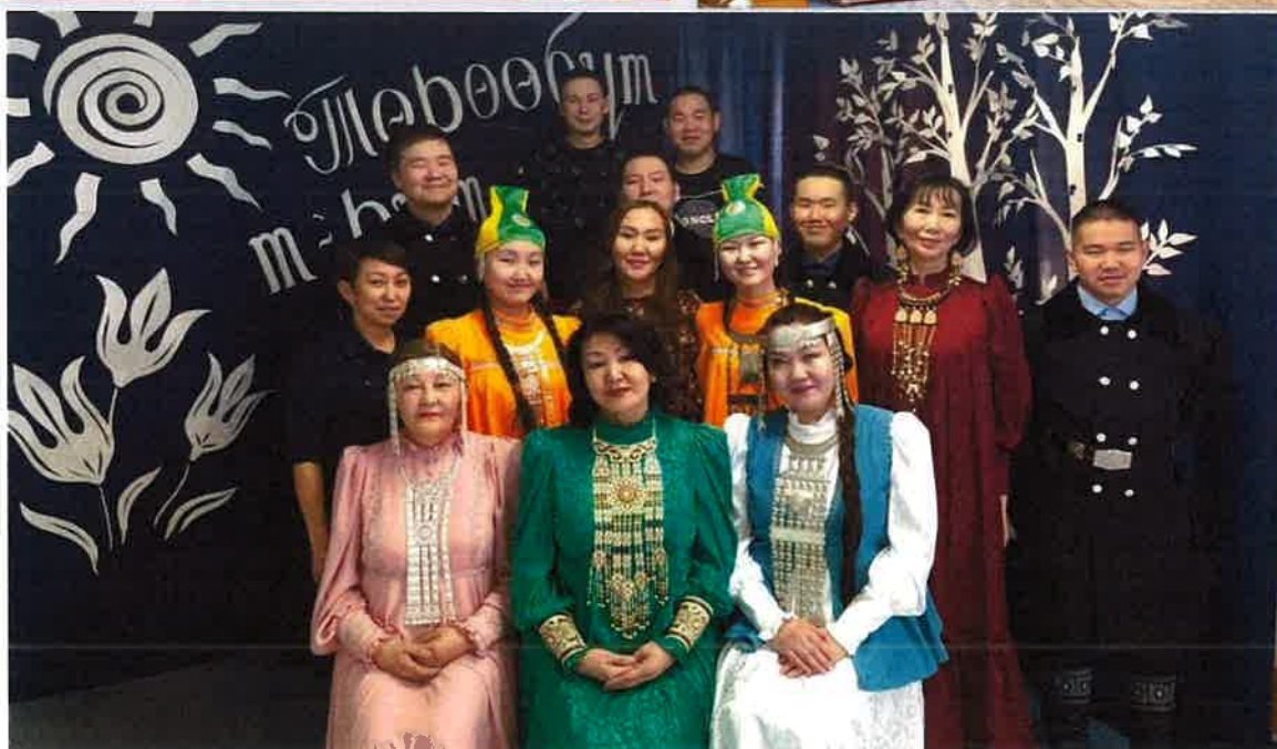
Фольклорный ансамбль «Кэнчээри»