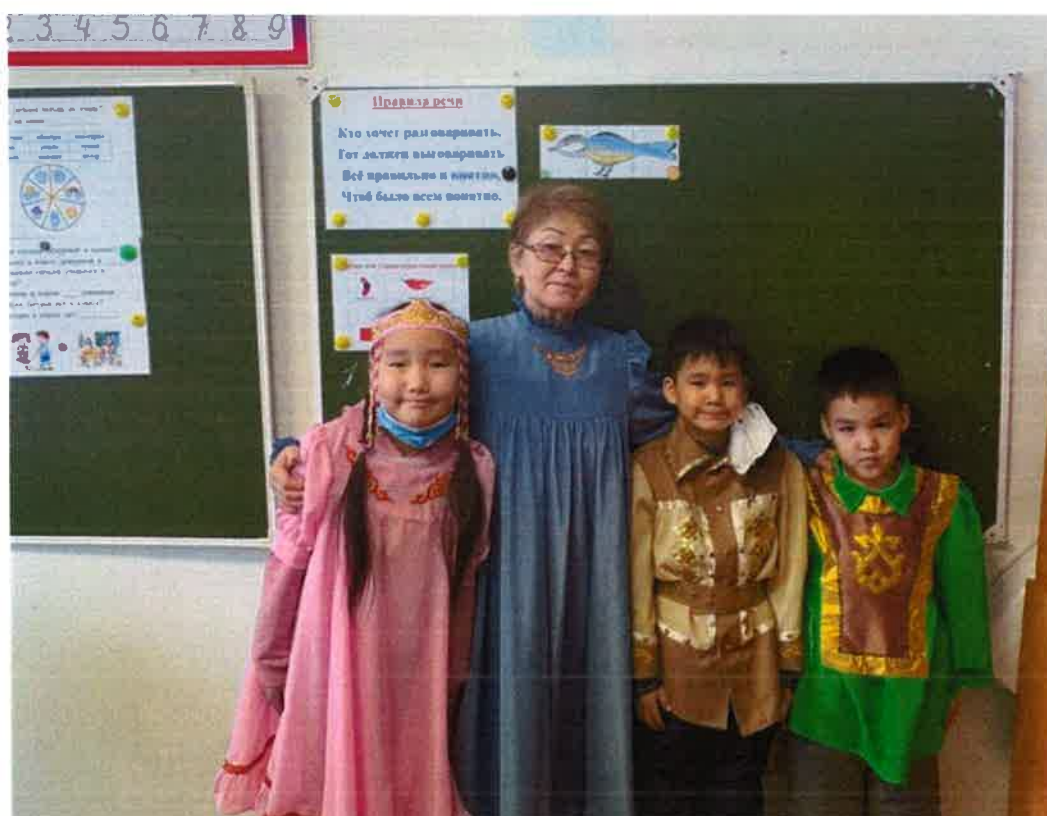
Обучающиеся 1 "в" класса – День национальной одежды